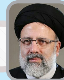
سید ابراهیم رئیسی

■ حسینی بوشهری که سابقه ۱۶ ساله در این مجلس دارد و با رای مردم استان بوشهر جواز حضور در دور ششم را بدست آورد، هم تسلط خوبی بر امور مجلس خبرگان رهبری دارد و هم گزینه ای مناسب برای ریاست این مجلس است. وی در هشت ساله دور چهارم مجلس خبرگان رهبری عضو هیئت رئیسه این مجلس بود و در دور پنجم هم نایب رئیس دوم مجلس بوده است.