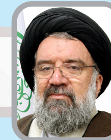
سید احمد خاتمی

آیت الله موحدی کرمانی پنج دوره نماینده مجلس شورای اسلامی بوده و در تمام ادوار مجلس خبرگان حضور داشته است. وی در دوره ششم نیز از استان تهران در مجلس خبرگان حضور دارد و یکی از گزینه های ریاست مجلس خبرگان است.