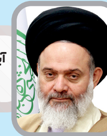
آیت الله حسین بوشهری