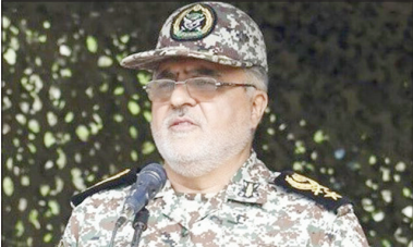
فرمانده قرارگاه پدافند هوایی خاتم‌الانبیاء(ص) با بیان اینکه کریدورها کاملاً باز شده و پروازها در حال انجام است، گفت: اعلام می‌کنیم آسمان ایران در مقابل هر گونه تجاوز ناامن است و اگر دشمن تجاوزی داشته باشد با پاسخ مهلک پدافند هوایی مواجه خواهد شد.