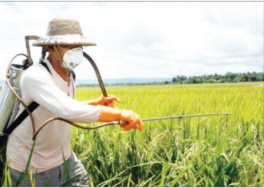
یک کشاورز در حال مبارزه با بیماری در مزارع گلستان