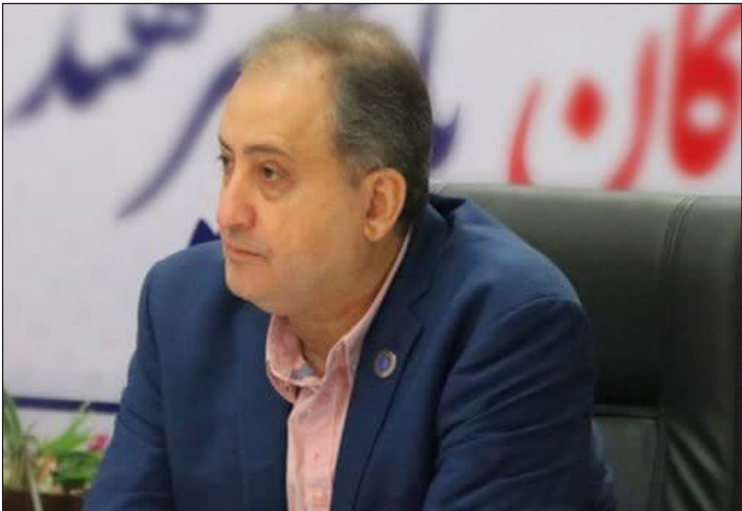
مسلمان دهقنی خبرنگار

به میزبانی اتاق بازرگانی هرمزگان و با حضور نماینده ولی فقیه در استان و امام جمعه بندرعباس، نماینده مردم هرمزگان در مجلس شورای اسلامی، رییس و اعضای هیات رییسه اتاق بازرگانی هرمزگان ، رئیس انجمن ماهی شناسی ایران ، رییس دانشگاه هرمزگان ،امام جمعه اول سنت بندرعباس و جمعی از فعالین بخش خصوصی در حوزه شیلات یازدهمین کنفرانس ملی ماهی شناسی ایران در سالن همایش این اتاق در بندرعباس ، ۵ و ۶ اردیبهشت ماه برگزار شد.