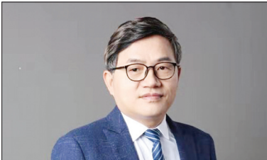
لوئو لی آن تحلیلگر سیاسی و روزنامه‌نگار در چین

این کاوش نه تنها الگوی گشایش قابل‌قتباسی برای سایر مناطق آزاد تجاری چین می‌کند، بلکه مسیر توسعه جدیدی از نوع باز، فراگیر و پایدار برای جهانی‌سازی در عصر جدید ارائه می‌دهد.