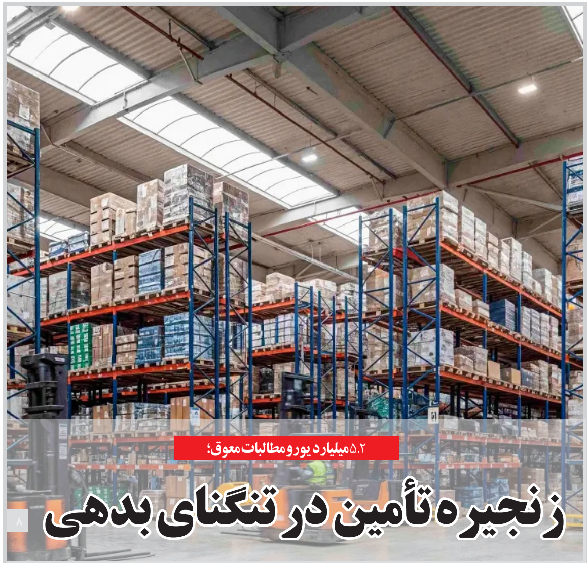
۵.۲ میلیارد یورو مطالبات معوق؛