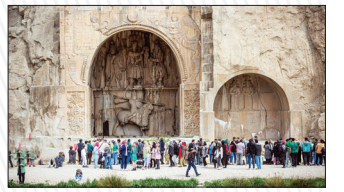
گردشگری ایران در توقفگاه اضطراری