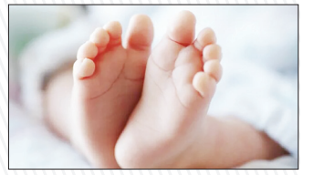
روند کاهشی ولادت طی ۴ سال اخیر