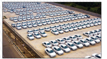
دو گانه منفی خودرو