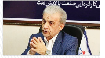
ناترازی نفت گاز مهار شد