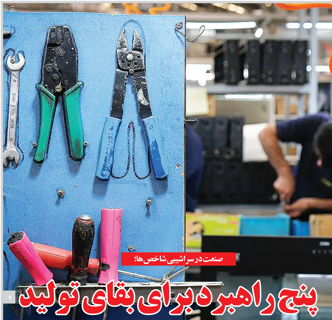
صنعت در سراشیبی شاخص ها: