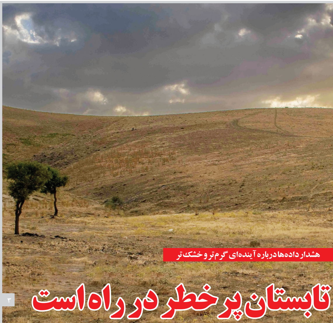
هشدار داده‌ها درباره آینده‌ای گرم‌تر و خشک‌تر